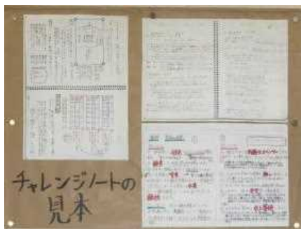
掲示物でノート活用の指導

りしで 題お言・一自か始用 した ま各にり葉感学自分か後例 ハ が学しまで想習ののるすでイ す。らよ年てす記。の成生では、 、うでみ。述。の振。長徒に、 指、もてご。欄。を。が85 導お、く家。に。返。を。お を手有だ庭。に。り。じ。り し本効さで生。自。ま。取。目 てを活いも徒。分。と。り。す お示用。話。め。の。め。り