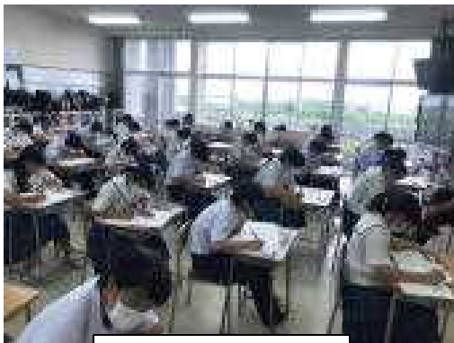
真剣な表情の三年生

気精校思 持一生い ち杯徒が にのに感 なりエ頼 ましられ ました。 り感じ、 たい本