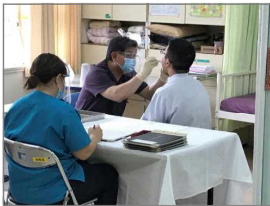
歯科検診の様子 4月15日

りま学校での保健行事が新学期から始 ロナウィルス対策により定期 日を遅らせることは、実 が、今年度はこれまで の、対策を施して、例 診など。6月までの計、年内 7種の検査結果によつて、予 で検査の結果、必要とならば、再 護者の皆様に通知がござい ます。中学生の心身は、この 健康に大切だと考えておす も大切だ、と考へます。こ を機に、改めてお子様と健 康を維持、増進の話題に みてはいかがでしょう。