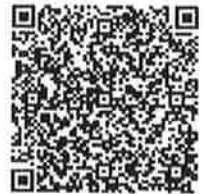
沖縄県電子申請サービス

右のQRコードを読み込み、沖縄県電子申請システムで提出してください。 電子申請システムでの申請は、 4月6日まで