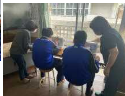
家庭科ミシン指導ボランティア↓