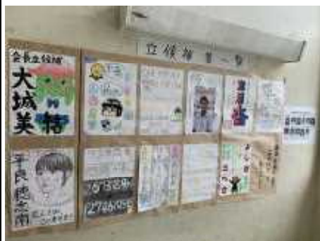
立候補者ポスター