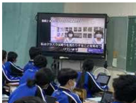
意見交換会(録画放送)