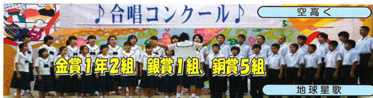
金賞1年2組 銀賞1組、銅賞5組