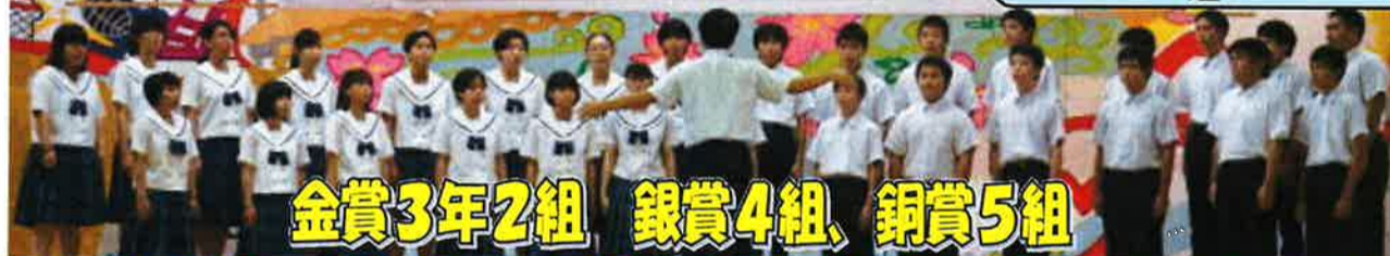
金賞3年2組 銀賞4組、銅賞5組