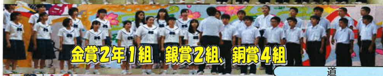
金賞2年1組 銀賞2組、銅賞4組