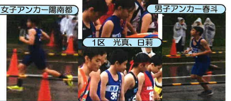
女子アンカー陽南都

大雨の中11月3日（土）にうるま市の与那城陸上競技場をスタートし、海中道路のコースで地区駅伝大会がありました。