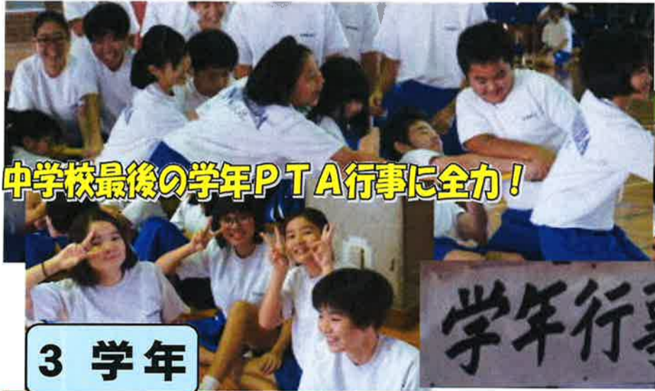
中学校最後の学年PTA行事に全力！