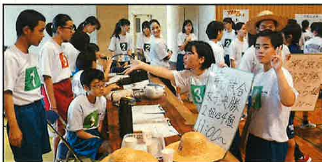
見事な執行部や各専門員会の自治活動(運営)