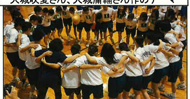
昨年よりスクラムを組む姿が多く見られました

【メーリングサービス登録】 * 生徒の活躍状況やHPの 新着情報、台風、津波な ど、危機管理時に!