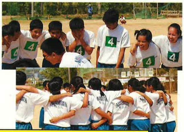
学級の絆づくり：仲間と自主的な円陣・スクラムとアピール表現