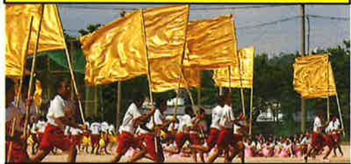
秋風のもと、躍動感あふれる演技