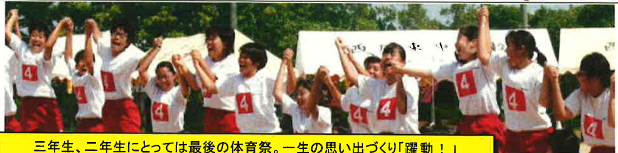
三年生、二年生にとっては最後の体育祭。一生の思い出づくり「躍動！」