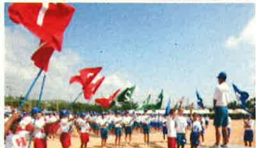
応援団賞三連覇の自信が開会式でも