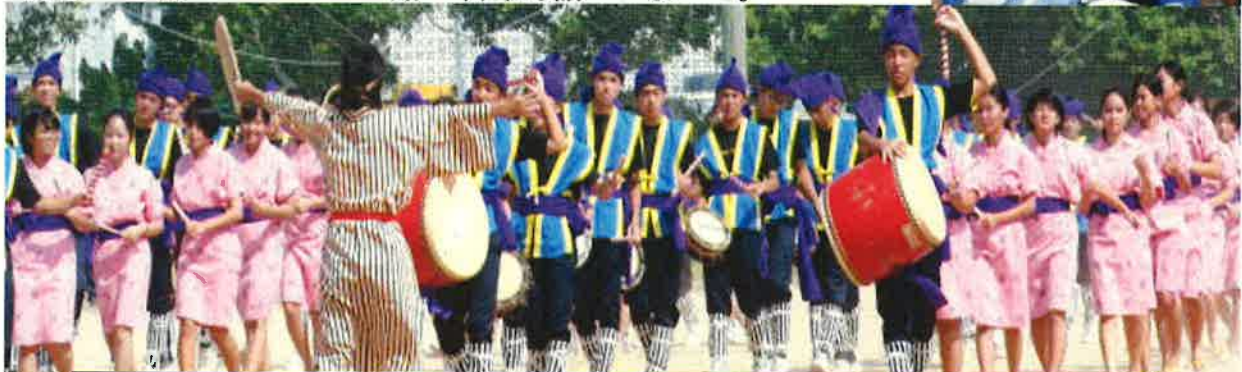
さすが最上級生！堂々とした演舞は夏休み期間からの遅くまでの練習の成果です

【メーリングサービス登録】 * 生徒の活躍状況やHPの最新情報、台風、津波など、危機管理時に