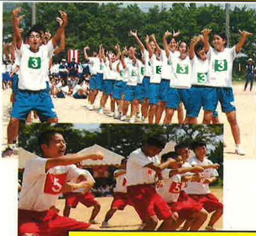
かなまる会パワー炸裂！40名の来賓の皆さまをはじめ、多くの保護者、関係者の方々に感謝です