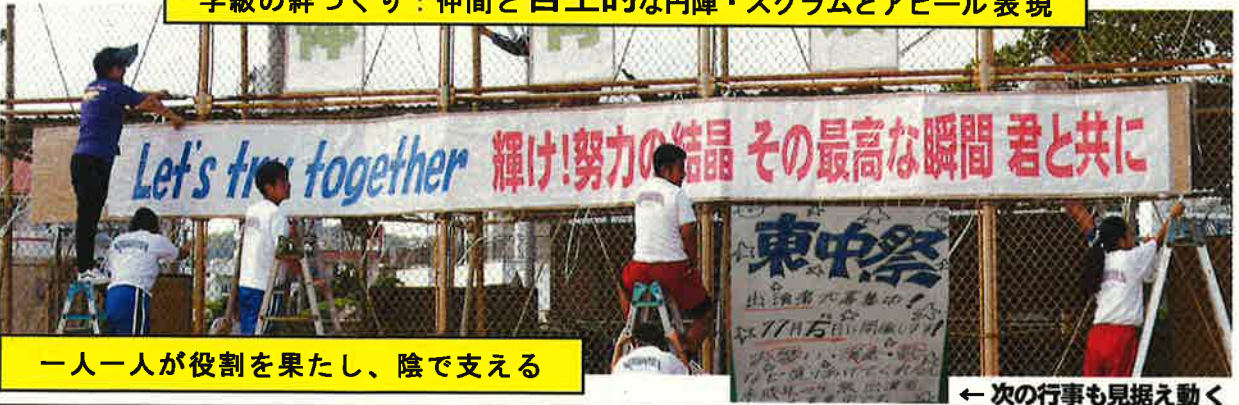
一人一人が役割を果たし、陰で支える