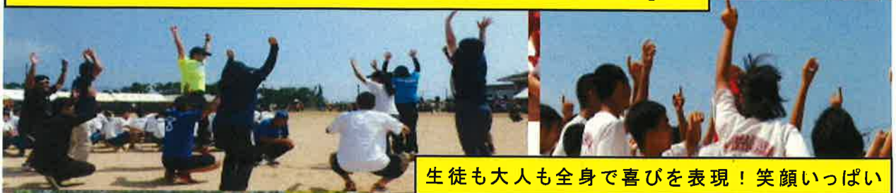
生徒も大人も全身で喜びを表現！笑顔いっぱい