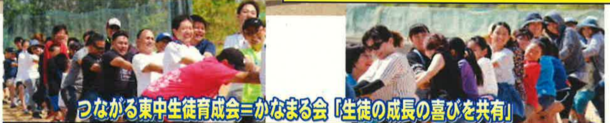
つながる東中生徒育成会＝かなまる会「生徒の成長の喜びを共有」