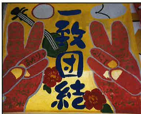
想いや願いのつまった学級旗