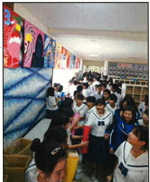
熱気ムンムン!学級旗の投票