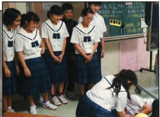
各チーム短い時間で出し物まで準備!